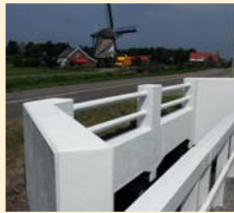
Beton als nieuw in Uitgeest.