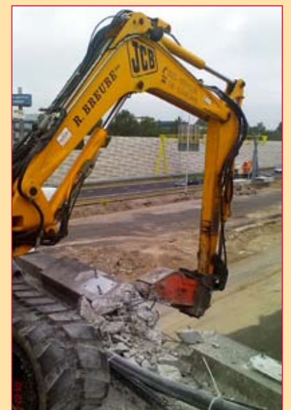
Verwijdering van beschadigd beton.