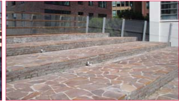
De trap aan het Lichtplein in Eindhoven mag gezien worden.

Na verschillende succesvolle renovatieopdrachten aan civiele kunstwerken heeft de gemeente Eindhoven Batec ook ontdekt als partner voor onderhoud aan culturele kunstwerken. De verborgen trap aan het Lichtplein mag sinds kort weer gezien worden.