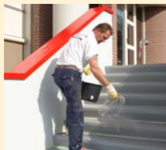
Trap wordt weer als nieuw.