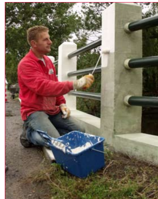
Onderhoud aan een Zaanse brug.

Het is niet de eerste keer dat Batec werkzaamheden voor de gemeente Zaanstad uitvoert. Batec heeft de afgelopen tien jaar al vele civiele kunstwerken voor hen gerenoveerd. De werkzaamheden aan de vijftien bruggen zijn inmiddels ook naar tevredenheid afgerond. ■