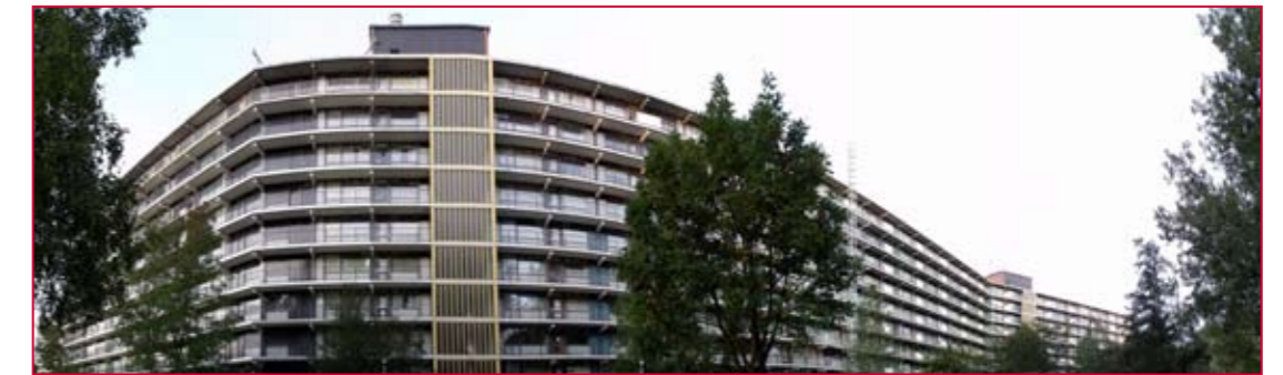
Batec geeft Bredase flats een metamorfose.

Batec neemt een flink deel van de metamorfose op zich.