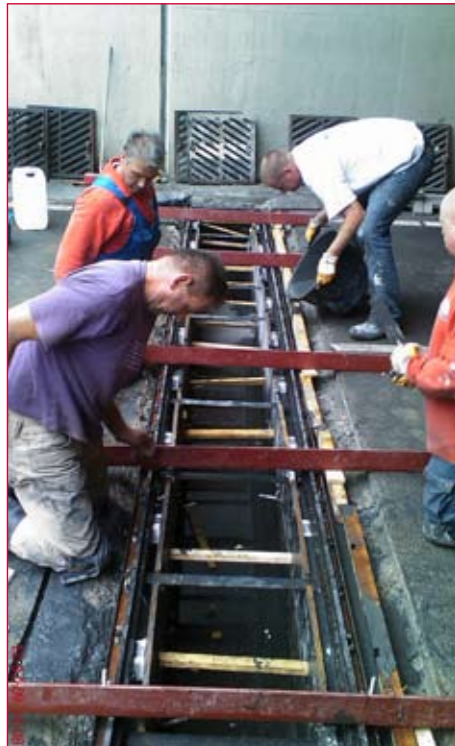
Aangetaste waterafvoergoot wordt gerepareerd.

Onderdelen van de tunnelbak aan de Europaweg in Zoetermeer, één van de belangrijkste doorgaande wegen daar, moesten vervangen worden. De putdeksels van de goten waren aan het verzakken waardoor er gevaarlijke verkeerssituaties ontstonden. De gemeente Zoetermeer klopte bij Batec aan voor hulp.