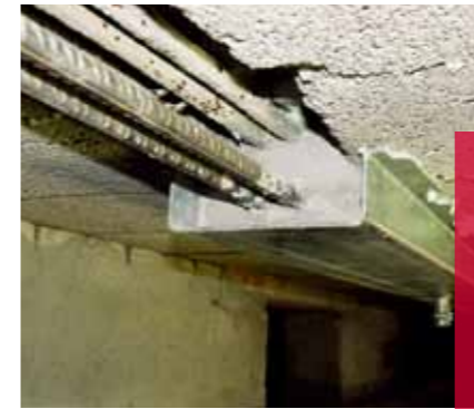
Schade aan betonnen T-liggers

Batec ging terug naar school. Niet om bij te leren, maar om de betonnen vloer van een gymzaal van basisschool De Tandem in Uden grondig op te knappen. Want dat was om veiligheidsredenen hard nodig.