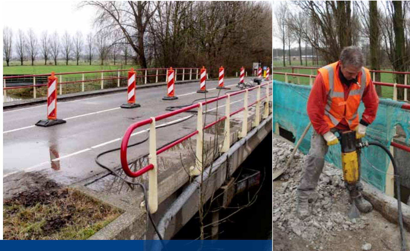
Na deze opknapbeurt kan de brug weer jarenlang mee

Batec kent de gemeente Wijchen als de eigen broekzak. Want het bedrijf is er al zeven jaar kind aan huis. Dat begon in 2003 met een inspectie in het kader van de Meerjaren Inspectie en Onderhoudsplan Kunstwerken (MIOK). Sinds dat plan is afgerond worden jaar na jaar projecten uitgevoerd.