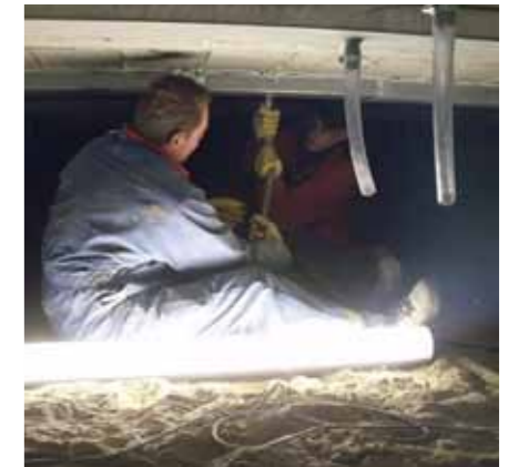
Batec was vooral onder de gymzaal actief

Alle losse en gescheurde delen zijn verwijderd tot op de opleggingen, inclusief de bestaande oude hoofdwapening van de aangetaste liggers. Aan de onderzijde van de T-liggers zijn koudgewalste thermisch verzinkte u-profielen aangebracht. Batec heeft ze extra stevig mechanisch bevestigd aan de ondergrond. In de u-profielen is nieuwe wapening geplaatst. Die is met hoogwaardige cementgebonden injectiemortel gevuld.