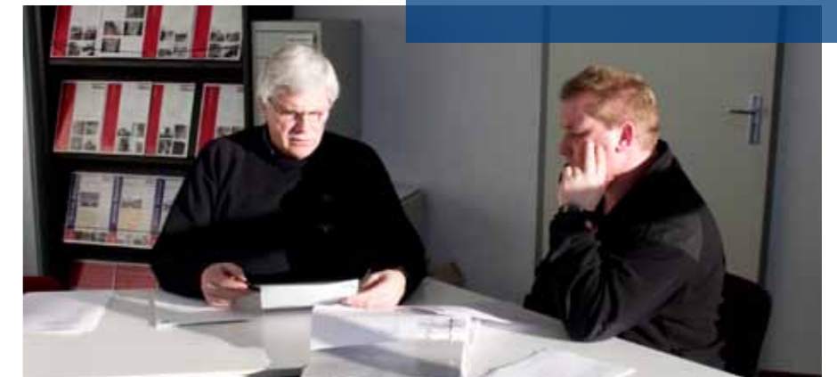
Op weg naar het EVC-certificaat

Meer weten over Batec? Kijk op www.batec.nl , stuur de antwoordkaart ingevuld retour of bel met 0418 - 63 56 98.