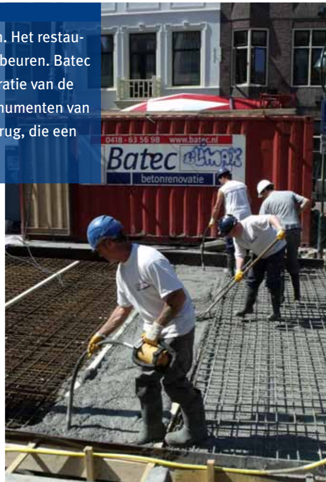
Eén van de belangrijkste watermonumenten van Gouda is onlangs door Batec gerenoveerd

Het nieuwe betondek is 30 mei gestort. Aansluitend werd de bestrating op de brug in oude stijl hersteld om het historische karakter van het monument te behouden. De monumentale leuning waren ondertussen in de werkplaats hersteld en geconserveerd en konden op de brug teruggemonteerd worden. Zowel de sluis als de brug kunnen er dankzij Batec weer vele decennia tegenaan.