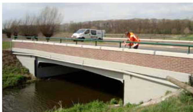
De twee bruggen in de gemeente Oude IJsselstreek zien er weer piekfijn uit.

In de gemeente Oude IJsselstreek in de Achterhoek zijn 58 civiele kunstwerken door een onafhankelijk ingenieursbureau geïnspecteerd. Aan twee bruggen moesten diverse onderhoudswerkzaamheden uitgevoerd worden. Batec stak de handen uit de mouwen.