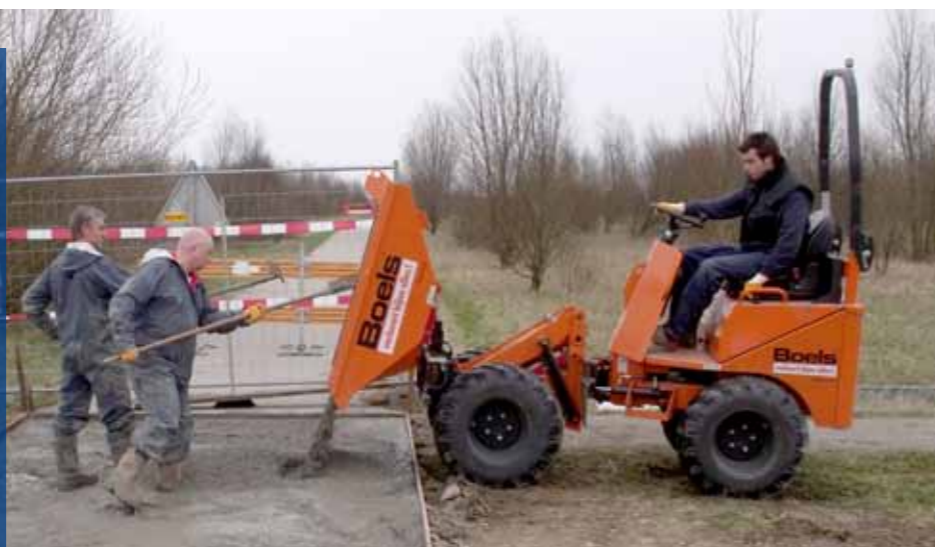
Er kan weer volop gerecreëerd worden in Zwaansbroek.

In opdracht van de provincie Noord Holland Dienst Landelijk Gebied, heeft Batec betonverhardingen aan betonpaden hersteld in recreatiegebied Zwaansbroek in de gemeente Haarlemmermeer.