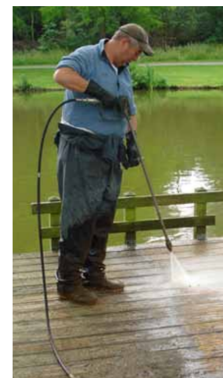
Met de werkzaamheden in Tilburg is door Batec snel een begin gemaakt.

Meer weten over Batec? Kijk op www.batec.nl of bel met 0418 – 63 56 98.