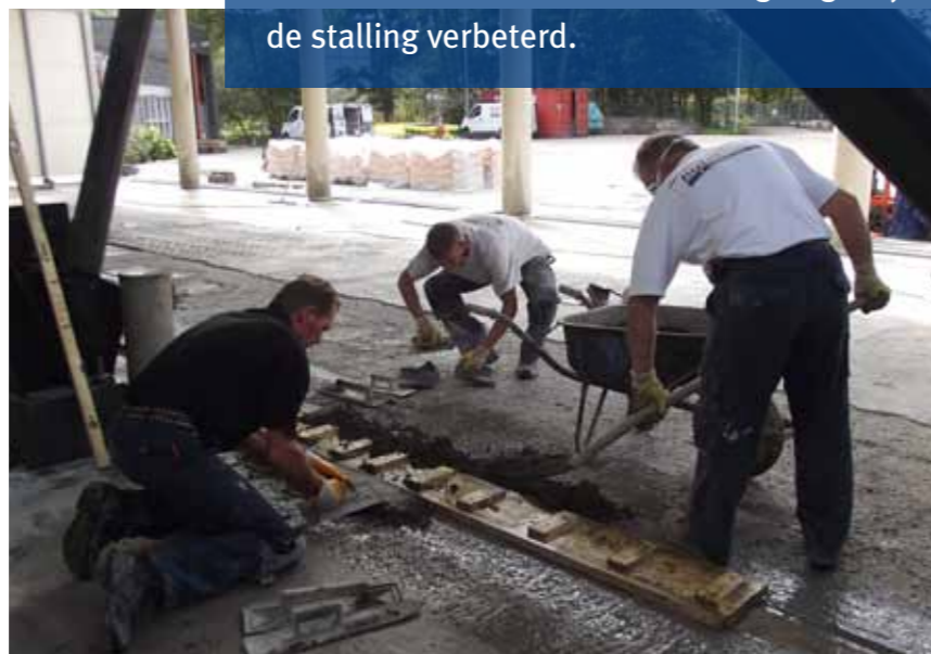
Nieuwe vloeren voor de stalling voor zoutstrooiers in Overveen.

De provincie Noord-Holland is klaar voor de winter. Tenminste, voor wat betreft de stalling voor zoutstrooiers van het steunpunt in Overveen. Die is door Batec voorzien van een vloeistofdichte vloerafwerking. Ook is door Batec het afschot van de betonvloer van de garage bij de stalling verbeterd.