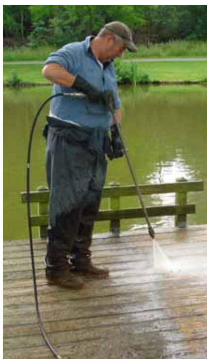
Met de werkzaamheden in Tilburg is door Batec snel een begin gemaakt.

Meer weten over Batec? Kijk op www.batec.nl of bel met 0418 – 63 56 98.