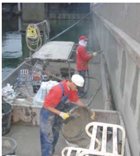
renovatie van de kolkwand in de Marijkesluis

Direct toen de stremming begon zijn met een speciale kraan diverse hangsteigers in de colk geplaatst. Zo kon op twintig locaties gelijktijdig gewerkt worden. Omdat het werk af moest in een relatief korte periode werd ook in het weekend doorgewerkt.