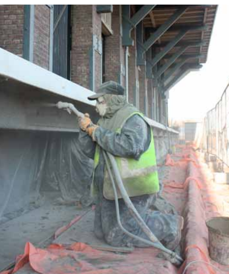
Aanbrengen extra dekking met spuitbeton

De oude Van Gend & Loos-loods en de bijbehorende laad- en losperrons op het station in Maastricht, waren dringend toe aan een opknapbeurt. Aan Batec het verzoek om de betonreparatie aan het oude pand, eigendom van NS Stations, uit te voeren.