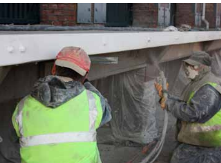
Bekistingen zijn aangebracht