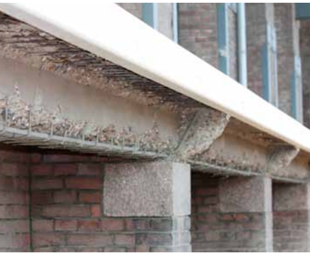
Gesaneerde ondergrond is gestraald