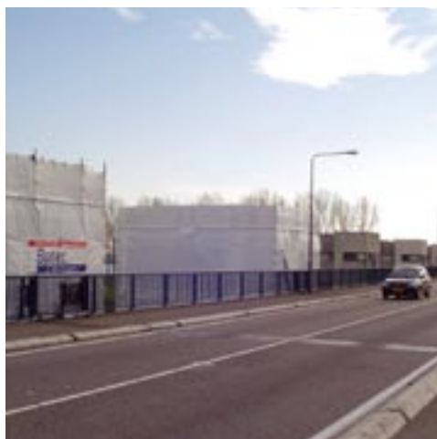
De "ingepakte" spuisluizen in Nijkerk tijdens de reparatie

De renovatie van de spuisluizen van de Krabbersgatsluis in Enkhuizen en de Nijkerkersluis in Nijkerk is inmiddels door Batec binnen een strakke tijdsplanning uitgevoerd. Rijkswaterstaat is tevreden over het uitgevoerde werk, want het voldoet aan de prestatieeisen en vereiste kwaliteit die in het bestek zijn vastgelegd en daar was het om begonnen.