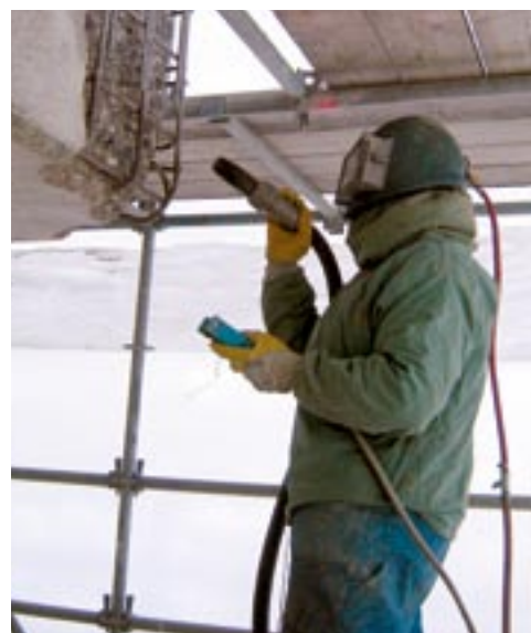
Reinigen van de ondergrond door gritstralen