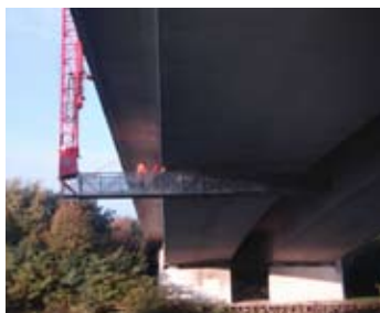
Reparatie vanuit laagwerker