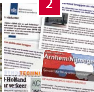
2 Bruggen en viaducten in slechte staat