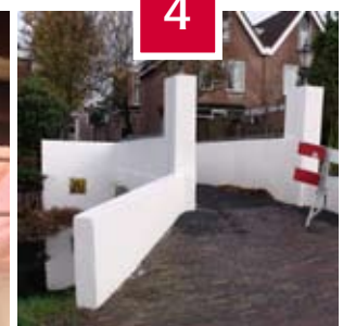
4 Recent uitgevoerd werk