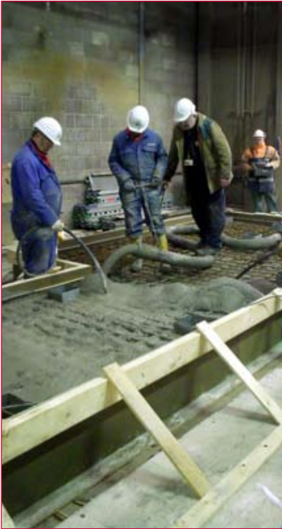
Aanbrengen beton voor fundatie