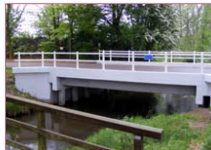
Gerenoveerd en weer veilig

Veel schade aan de onderzijde is inmiddels gerepareerd. Na het saneren werd de ondergrond en de wapening gegritstraald en werd