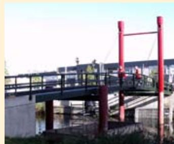
Brugrenovatie in Naarden