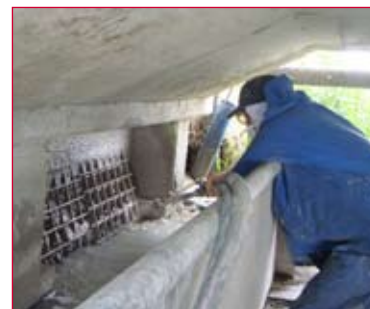
Herstel talud met spuitbeton

met de schampranden werden goten gemaakt en zijn gietasfaltstroken aangebracht. Deze zorgen voor een waterdichte aansluiting. De schampranden zijn gerepareerd en geconserveerd.