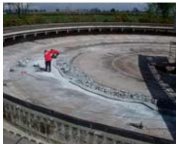
Sloopwerk losliggende vloer

Renovaties aan diverse RWZI's voor Waterschap Rivierenland: