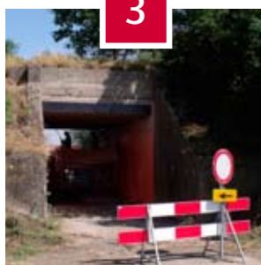
Aan het lijntje