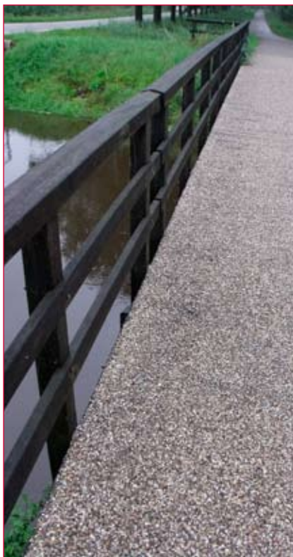
De nieuwe slijtlaag is aangebracht