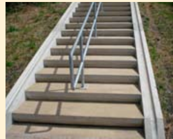
Een Nijmeegse trap voor en na het herstelwerk