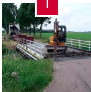
Batec komt over de brug