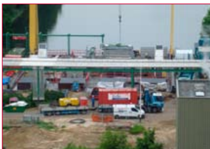
Volop bedrijvigheid op het filterdek

Onder auspiciën van Stork Thermeq voert Batec diverse werkzaamheden uit. Alle werkzaamheden die Batec in haar uitvoeringspakket heeft komen aan bod. Zo zijn er duizenden vierkante meters beton gereinigd met hoge druk water, zijn vele scheuren geïnjecteerd en zijn betonreparaties uitgevoerd. De reparaties gebeurden handmatig of door middel van de natte spuitbetonmethode.