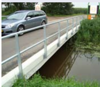
De brug weer klaar voor gebruik