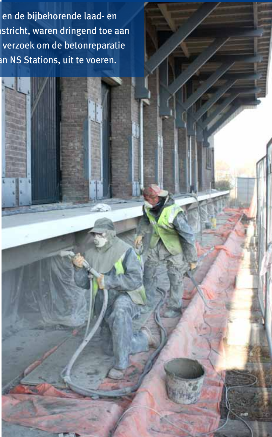
De oude Van Gend & Loos-loods op het station in Maastricht kan er weer tegen.

Batec begon met het verwijderen van de oude afwerkvloeren aan de bovenzijde en het saneren van alle slechte beton aan de onderzijde. Vervolgens werd alle vrijkomende wapening en het overige betonoppervlak grondig gestraald. Alle benodigde bekistingen zijn op maat gemaakt en geplaatst. De hele onderzijde van de perrons zijn grondig gerenoveerd en er werd extra dekking op de wapening aangebracht door middel van de natte spuitmethode met NSM-Multirep. De stalen profielen aan de voorzijde zijn voorzien van een nieuwe conservering en de bovenzijde van de perrons zijn voorzien van een nieuwe dekvloer onder afschot. Er is daarbij gebruik gemaakt van Floormix D40, dat zorgt voor een hoge kwaliteit.