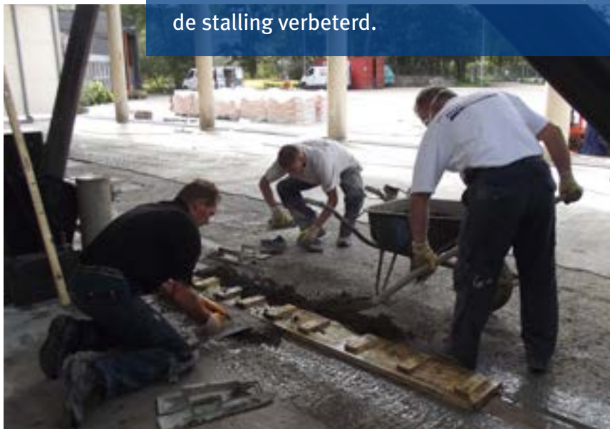
Nieuwe vloeren voor de stalling voor zoutstrooiers in Overveen.

De provincie Noord-Holland is klaar voor de winter. Tenminste, voor wat betreft de stalling voor zoutstrooiers van het steunpunt in Overveen. Die is door Batec voorzien van een vloeistofdichte vloerafwerking. Ook is door Batec het afschot van de betonvloer van de garage bij de stalling verbeterd.