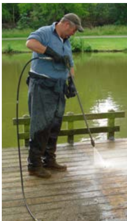
Met de werkzaamheden in Tilburg is door Batec snel een begin gemaakt.

Meer weten over Batec? Kijk op www.batec.nl of bel met 0418 – 63 56 98.