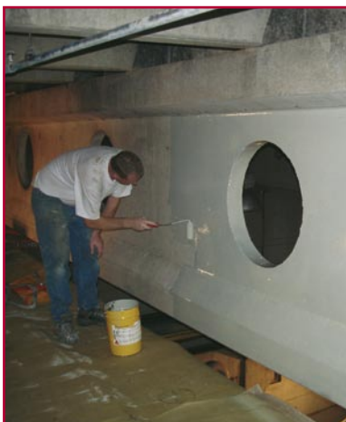
Medewerkers van Batec werkten de hele nacht aan een spoedreparatie in Renkum.

Na een brand is het voor bedrijven zaak om snel weer in touw te zijn. Papierfabriek Norske Skog Parenco in Renkum kan er over mee praten. Een korte, hevige brand zorgde voor flinke schade, vooral aan één van de papiermachines. Een week later was het bedrijf weer in productie. Mede dankzij Batec.