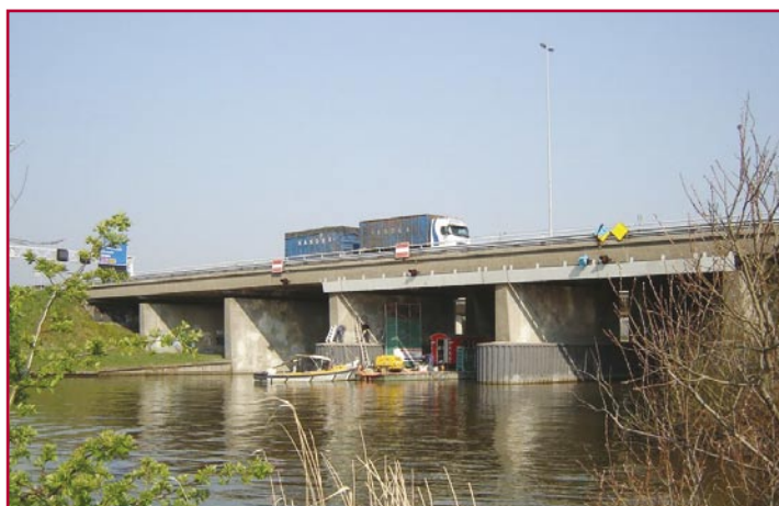
Bruggen, viaducten en sluizen: Batec renoveert ze in Utrecht.