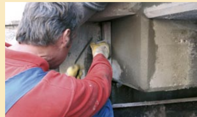
Detail van de uitvoering in Zaanadam.