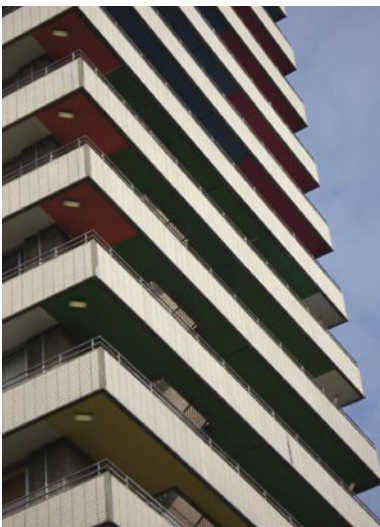
De plafonds van de galerijen in Wageningen hebben een kleurtje.

'Idealis is eigen wijs wonen' luidt de slogan van de Wageningse woningcorporatie. Die eigenwijsheid leidt tot opmerkelijke initiatieven. Wat gedacht van plafonds van galerijen in de opmerkelijk frisse huiskleuren van Idealis? Batec zorgde er, in het kader van een ingrijpende betonrenovatie van galerijen, voor.