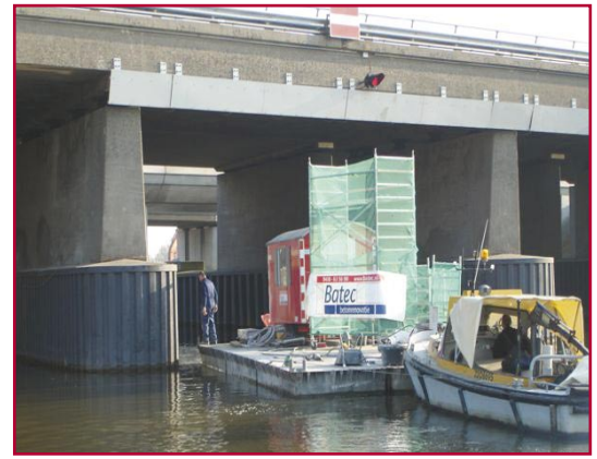
Werkzaamheden aan brug over de Linge.

Batec is in maart jl. begonnen met de uitvoering. De werkzaamheden zullen tot eind 2007 duren. ■