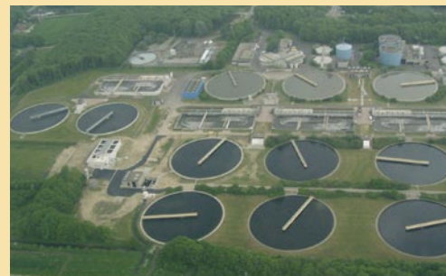
Overzichtsfoto van de nabezinktanks waarvan Batec de randen herstelde.

Zo'n project begint met een goede voorbereiding. Batec diende bij de opdrachtgever een werkplan en een veiligheidsgezondheidsplan in en ging pas na de goedkeuring daarop aan de slag. De bestaande, beschadigde epoxylaag werd met freesmachines compleet verwijderd. De betonnen ondergrond werd