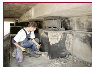
Saneren oplegblok van steunpunt.