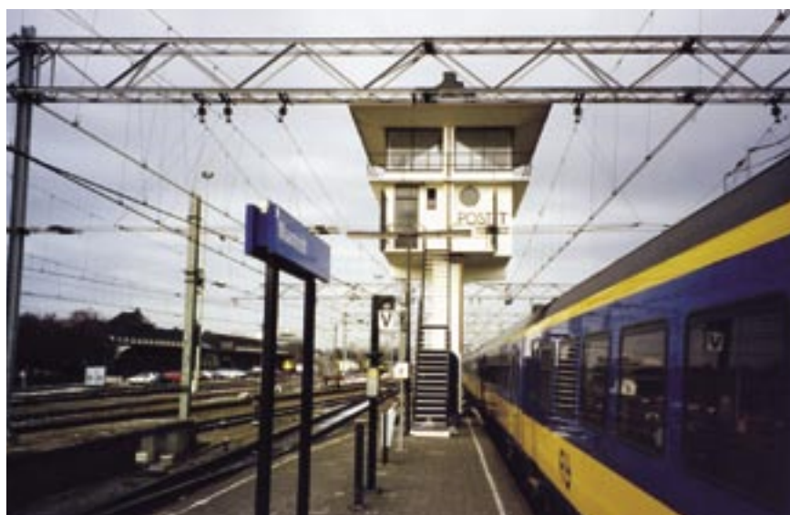
Renovatie seinhuis Post T in Maastricht

Onze slogan 'Heden en verleden bewaren voor de toekomst' verwijst niet alleen naar onze werkzaamheden, maar ook naar de manier waarop Batec bedrijfsmatig in de toekomst investeert. Door steeds op zoek te zijn naar innovatieve manieren om betonschade aan te pakken en (duurzaam) onderhoud te plegen zijn opdrachtgevers verzekerd van het beste resultaat.