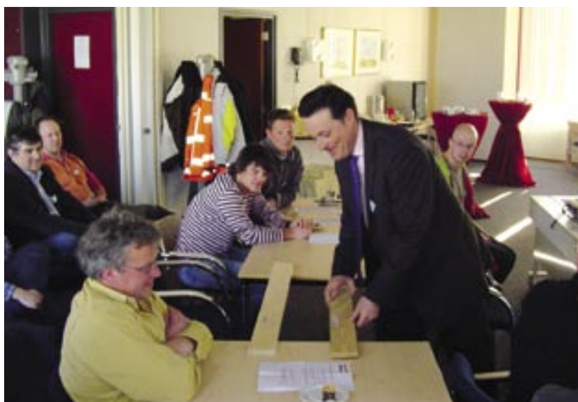
Er was veel aanschouwelijk materiaal tijdens de MIOK-bijeenkomsten.

Batec houdt de kwaliteit van haar producten, diensten en apparatuur regelmatig tegen het licht. Om erachter te komen in hoeverre ze nog voldoen aan de meest recente voorschriften en regels en aan de wensen van de klant. Liefst samen met die klant. Tijdens bijeenkomsten in 2005 en maart 2006 was het de beurt aan de zogenoemde MIOK (Meerjaren Inspectie en Onderhoud Kunstwerken) inspecties en rapportages.