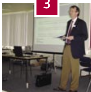
Bijeenkomsten over MIOK