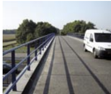
Eén van de door Batec uitgevoerde werken.