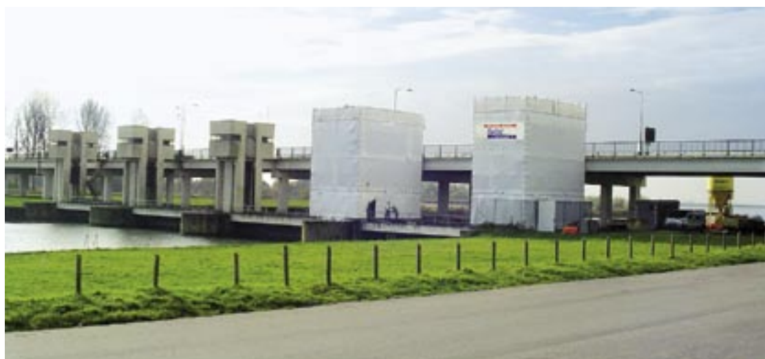
De spuilsluizen in Nijkerk tijdens de betonreparatie, uitgevoerd door Batec.

Zie maar hoe je het doet, het enige wat telt is het resultaat. Dat is de boodschap die opdrachtgevers bij prestatiebestekken aan hun leveranciers geven: de opdrachtgever beschrijft wat het gewenste eindresultaat is, de aannemer bepaalt zelf hoe dat doel wordt bereikt. Rijkswaterstaat heeft er ruime ervaring in, onder meer met Batec.