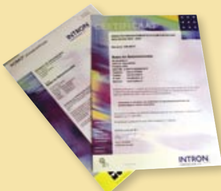
ISO en KOMO zijn opnieuw verlengd.

Het NEN-EN-ISO 9001:2000 en het KOMO procescertificaat zijn opnieuw verlengd voor een periode van drie jaar, tot 30 maart 2009. De inspectie en interne audit op 8 maart jl. verliep voor Batec zeer gunstig. Batec bezit het KOMO certificaat voor alle technieken in haar vakgebied: betonspuiten, handmatig repareren en injecteren.