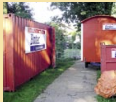
Batec zorgt goed voor materiaal (links: opslag) en mensen (rechts: bouwkeet).