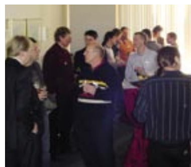
...en gezellig nagepraat.