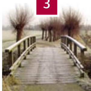
Over de brug met MIOK