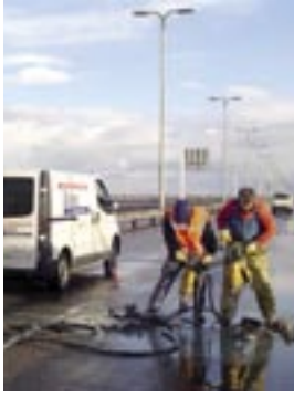
Batec repareerde het wegdek van de Haringvliet spuisluisen.

Betonreparaties in het wegdek van de Haringvliet spuisluisen voor Rijkswaterstaat Directie Zuid-Holland: