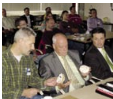
...door bezoekers geluisterd en gekeken...