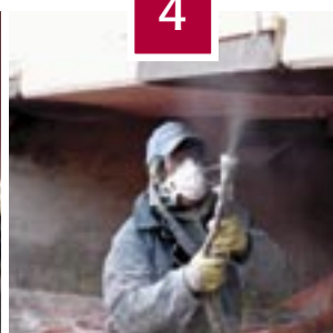
Werk in uitvoering