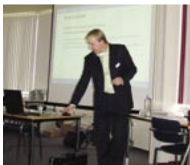
Er werd door sprekers verteld...

Beheerders van kunstwerken die – vaak om financiële redenen – onderhoud uitstellen, kunnen door Batec herinspecties laten uitvoeren. Zo'n hernieuwde rapportage met de actuele staat van onderhoud kan de gemeente uitsluitsel geven of verder uitstel verantwoord is.