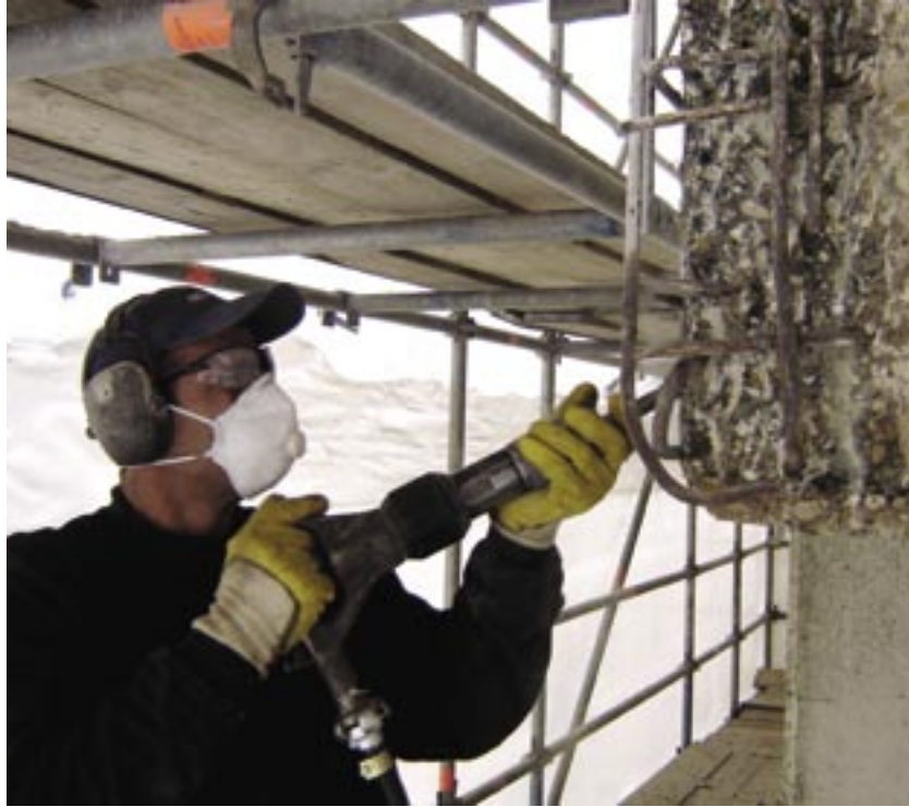
Boven en links: impressies van betonreparaties in Nijkerk.

Het prestatiebestek schreef bijvoorbeeld niet voor hoe Batec moest voorkomen dat er betongruis- en stof in het water terecht zou komen. Smit: "We hebben rondom alle